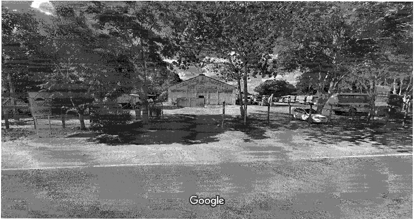
Captura da imagem: dez. 2018 © 2021 Google